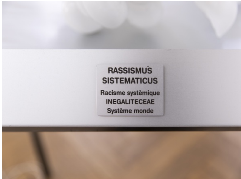
5 x 7 x 0,2 cm estampe sur aluminium avec réserve adhésive

En créant une flore imaginaire, j'ai voulu partager ce qui se trouve dans l'entre-deux où sont souvent poussées les personnes racisées. En concevant aussi des odeurs pour chacune des plantes, mon désir est de donner un aperçu de ce que l'on peut ressentir lorsqu'on subit les effets du racisme systémique. Incluant aussi la dimension coloniale inhérente au champs botanique, c'est en détournant ces codes que je souhaite apporter un regard critique.