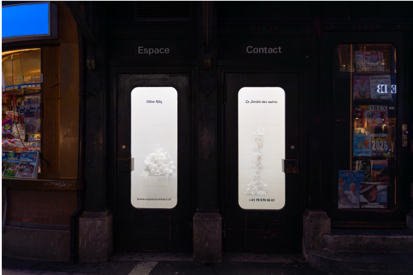
Espace contact, Place Pury, Neuchâtél