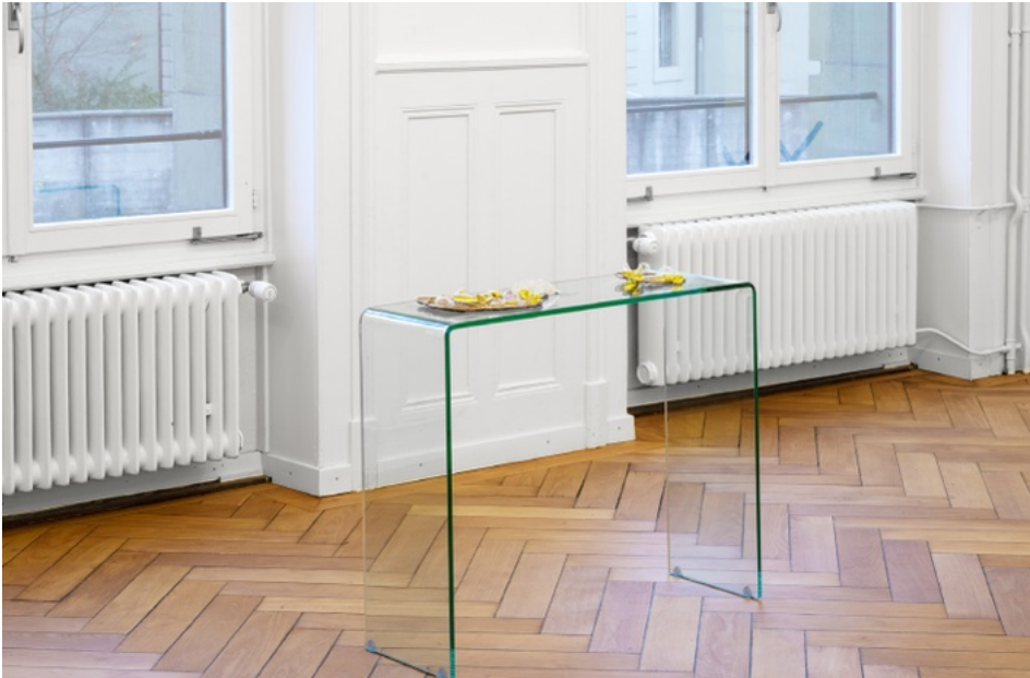
Support variable ou Tréteaux métal 92x50x80, plaque verre 150x80

Ma réflexion artistique explore les identités et l'altérité qu'elles représentent aux yeux des « autres ». Par nécessité. Par urgence. J'ai été séduite par des formes et des idées guidées par des intuitions. C'est là que j'ai commencé à douter de mon processus. Car l'ambiguïté qui est un droit tacite pour certain.es ne m'est pas accordé de la même façon. Les institutions artistiques attachées à ces « nouveaux » récits identitaires interprètent chaque détail de mon expression non pas en raison de mon intention, mais parce que mon identité implique cette lecture. On scrute un positionnement politique ou social. Alors, j'ai du mal à accepter qu'une œuvre puisse exister simplement parce qu'elle fait sens dans mon processus. Parce que c'est une manière de créer des versions ambiguës de soi-même.