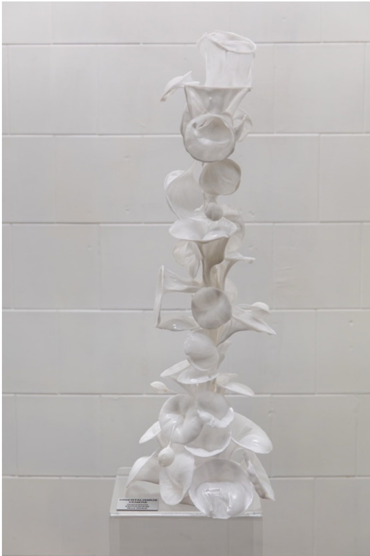
env. 30x 30x 200 cm