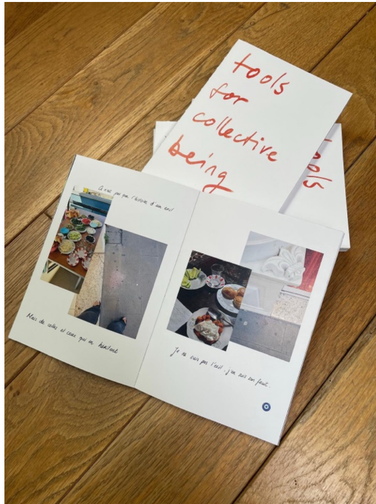
A5, 116 pages, Editing & Layout: Eglė Šalkauskyte & Olivia Abächerli

Contribution : double page (collage photographique)