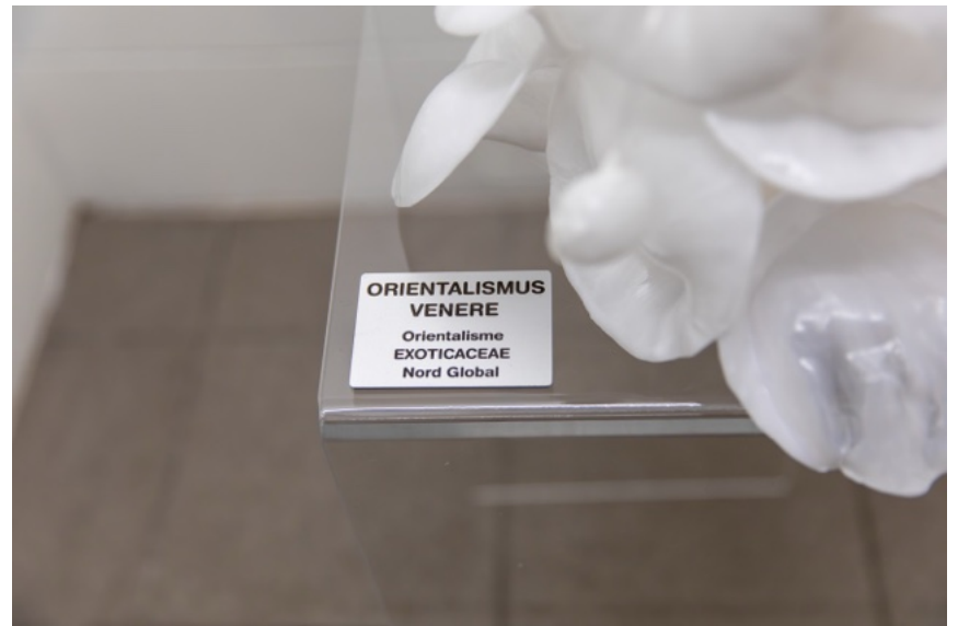
45x 50x 65 cm socle plexiglas