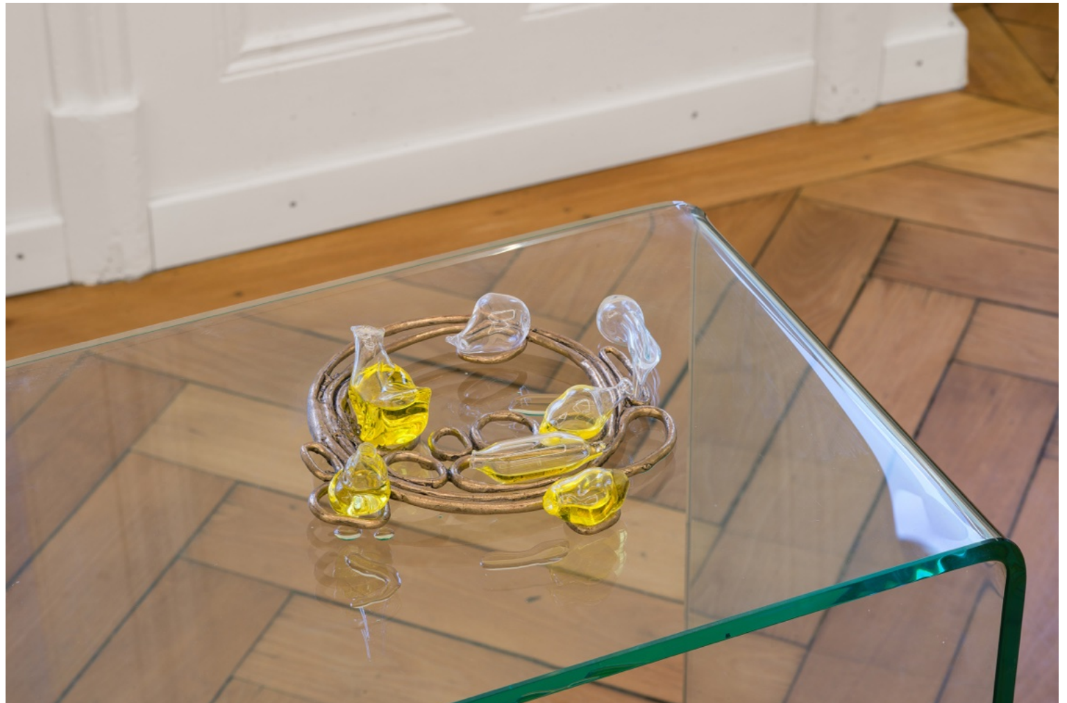
ø 15 cm , verre soufflé, bronze, composition olfactive naturelle et synthétique

Do I play with the codes of Orientalism? Do I exoticize myself? Or am I claiming the right to ambiguity? 2025