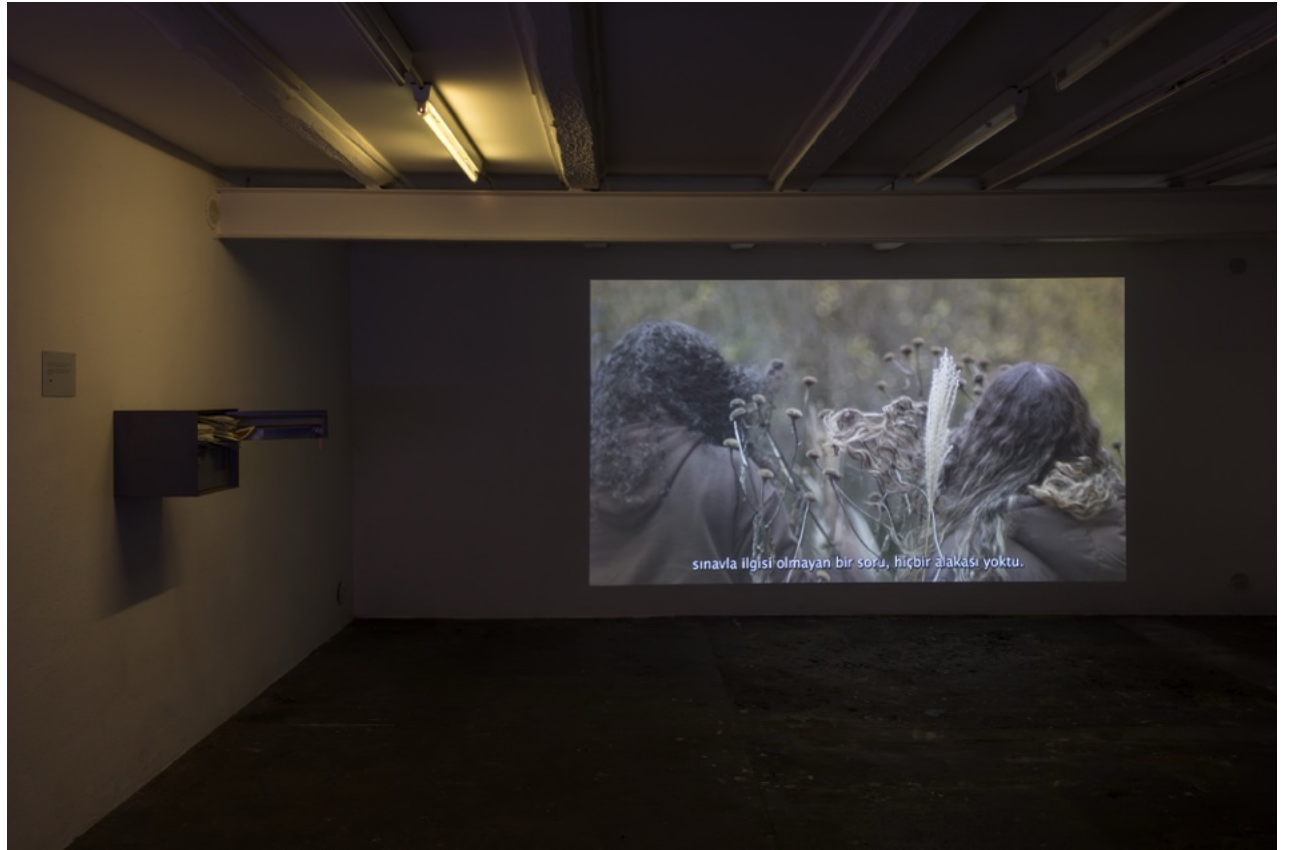
Wallstreet off space, Fribourg