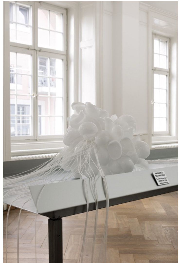
env. 40 x 50cm thermoplastique moulable