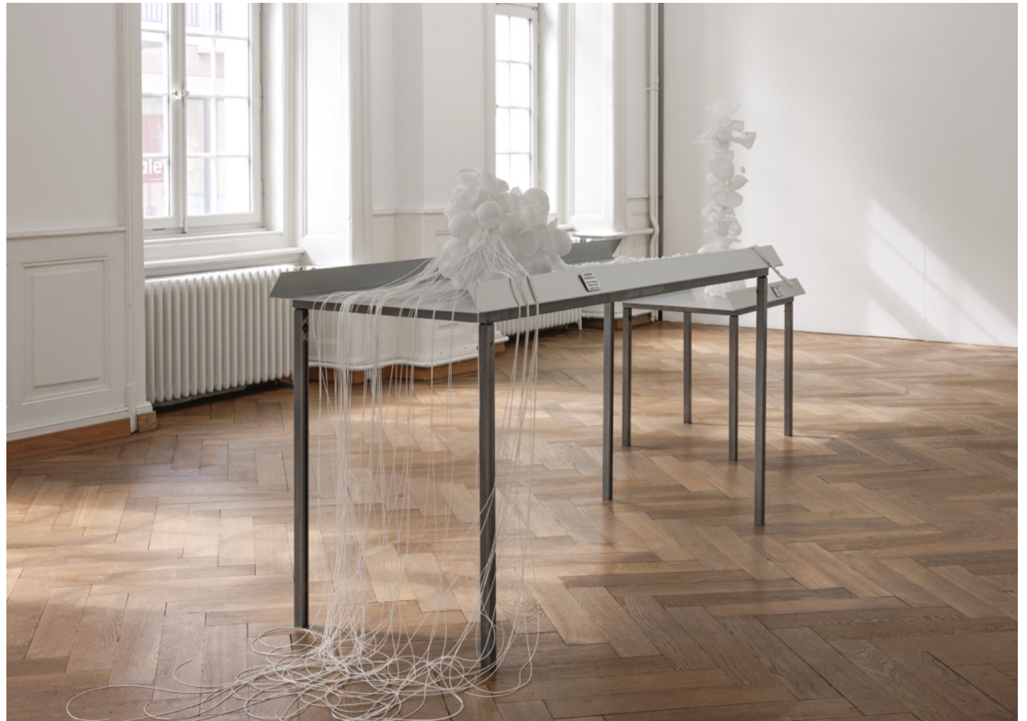
90 x 250 x 95 cm plaque aluminium, structure acier