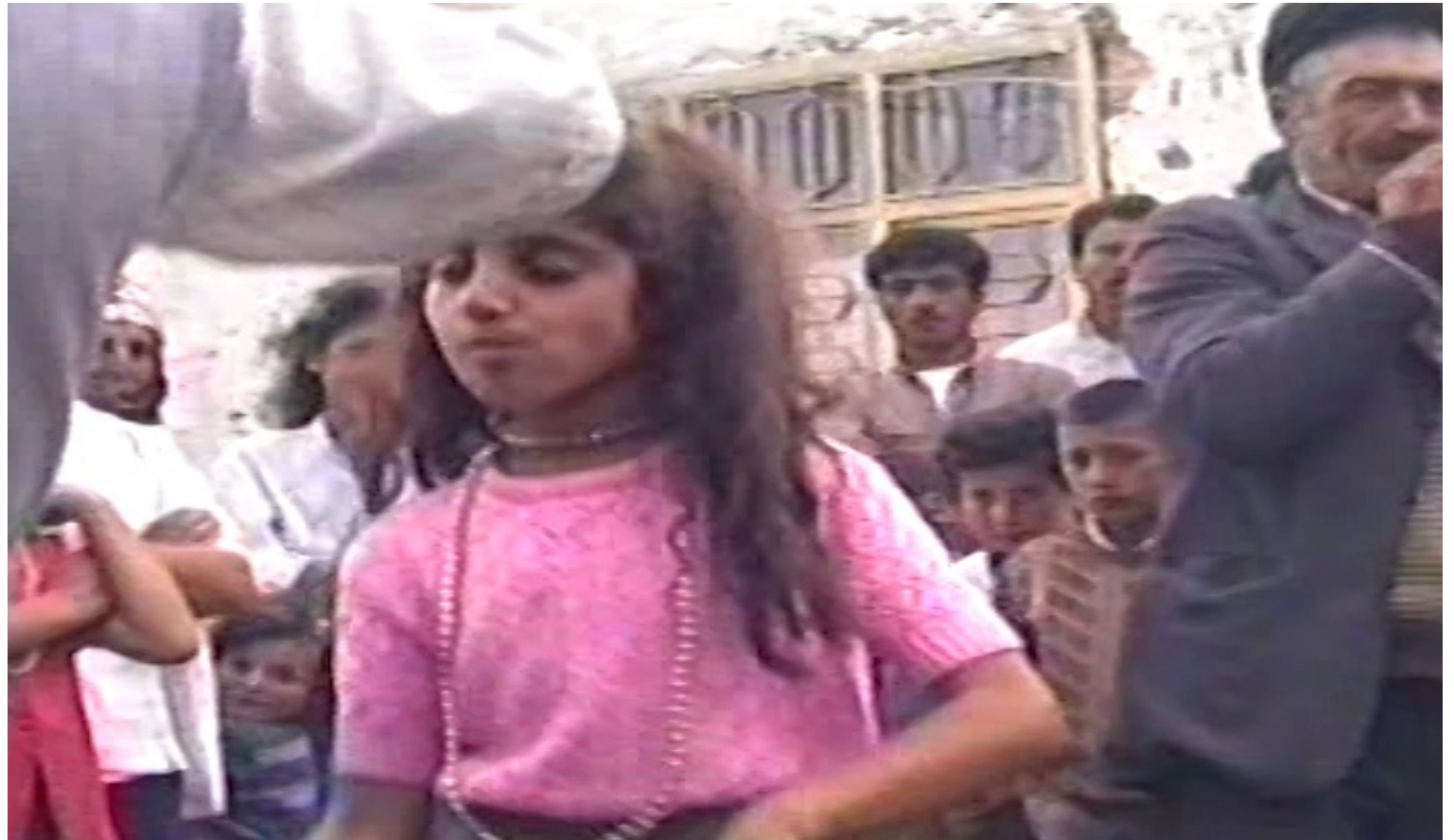
Capture d'écran de : Seni merak ettim. Je suis curieuse de toi. Min te meraq kir., 2021, projection vidéo monocanal, 8 min 45 sec, stéréo

Il s'agit d'un montage vidéo constitué d'archives familiales qui participaient à un échange entre ceux partis et ceux restés, proche de l'échange épistolaire où les images remplacent les lettres. Ce projet vise à montrer ce qu'il se passe pour ceux qui restent et l'influence qu'a l'exil sur ceux qui regardent partir.