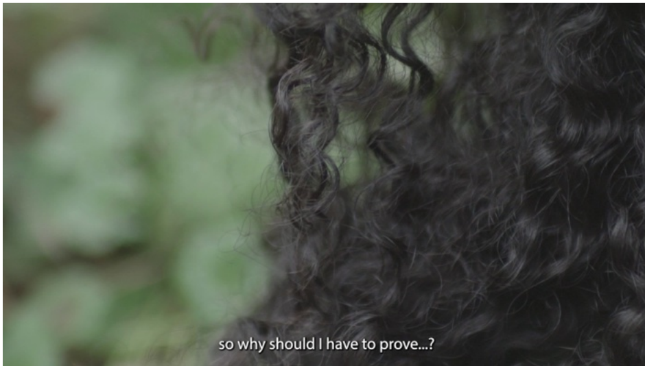
Capture d'écran: Xwe, 2022, projection vidéo monocanal, 07 min 14 sec, boucles, stéréo, dimensions variables

Par des témoignages sous forme de messages vocaux ce projet vidéo met en lumière le racisme dit ordinaire vécu au quotidien par deux personnes nées en Suisse. Les images sont abstraites et poétiques, elles laissent place à une contemplation qui permet l'écoute. Ce projet est accompagné d'une bande son coproduite avec Laure Betris.